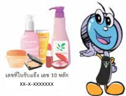
เลขที่ใบรับแจ้ง เลข 10 หลัก xx-x-xxxxxxx

⇨ อย่าใช้เครื่องสำอางร่วมกับผู้อื่น เช่น ลิปสติก เพราะอาจติดเชื้อโรคได้ โดยเฉพาะโรคติดต่อ เช่น เริม